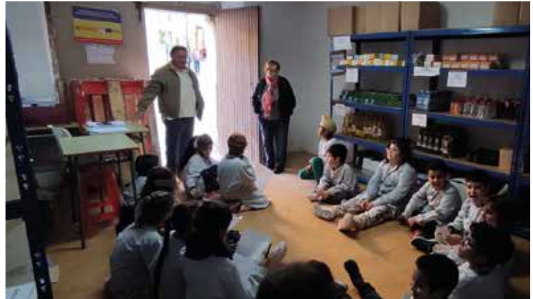
ApS, el Gran Recapte