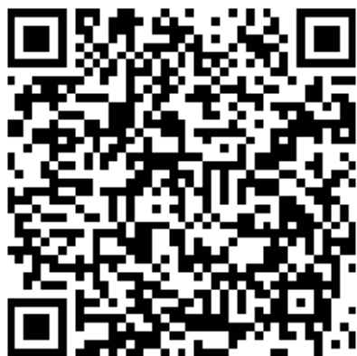
Família - Escola.