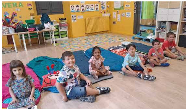
Dormida a l'escola