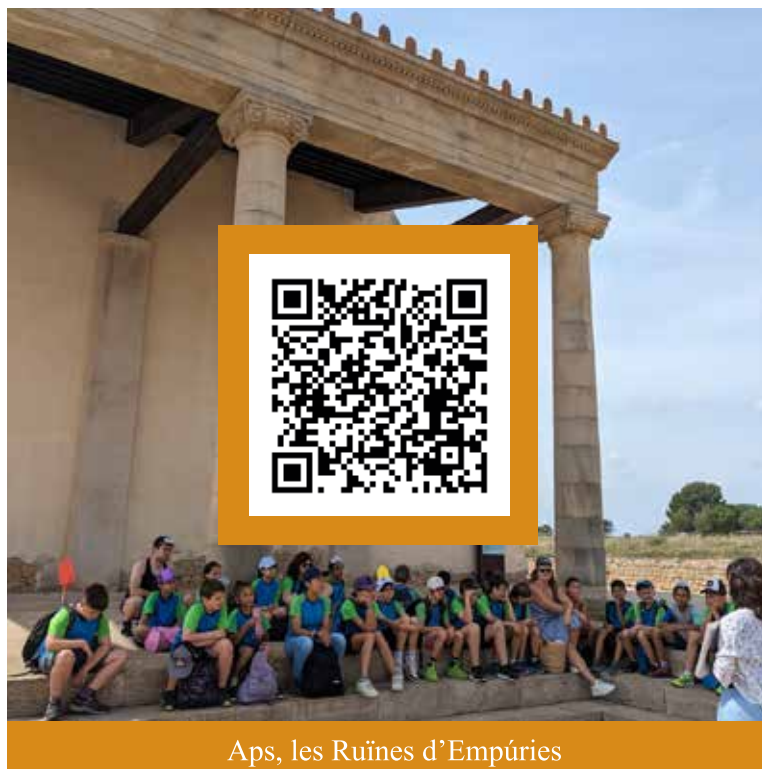
Aps, les Ruïnes d'Empúries