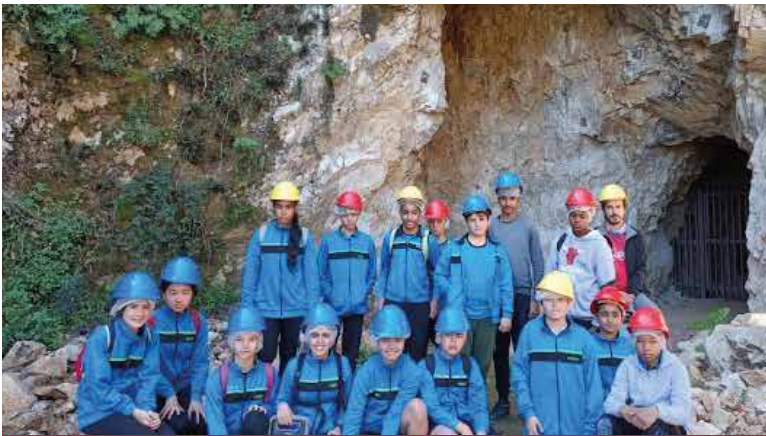
Credit de síntesi S1, les coves del Pasteral