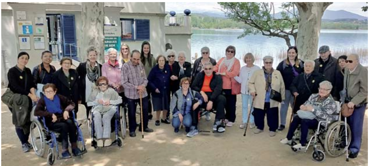
Excursió Centre de Dia a Banyoles