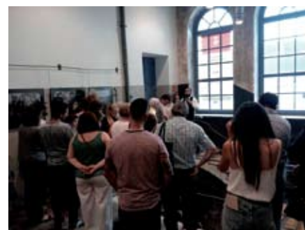
Viu la Burés