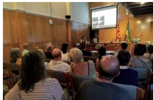
Sessió informativa plaça Palillos