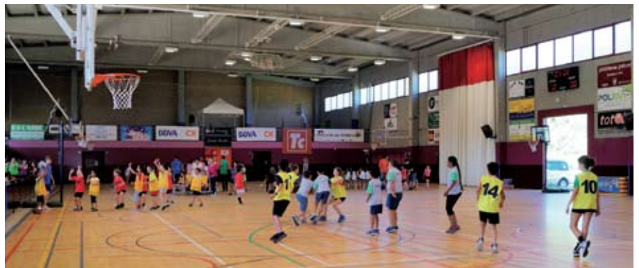
Memorial Josep Bosch