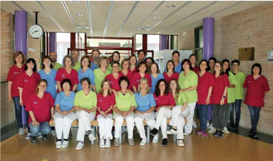
Nous uniformes Cap