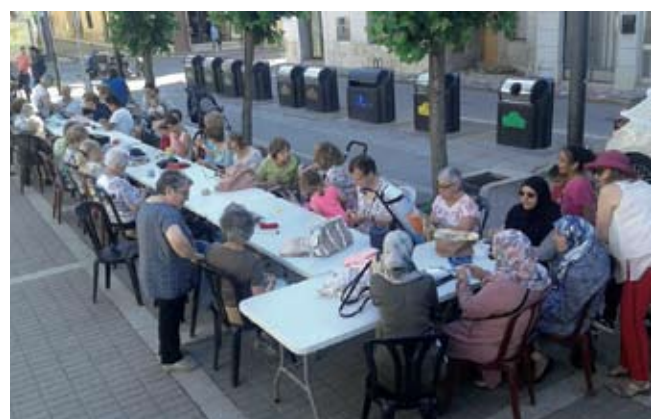
Dia Mundial de cosir al carrer