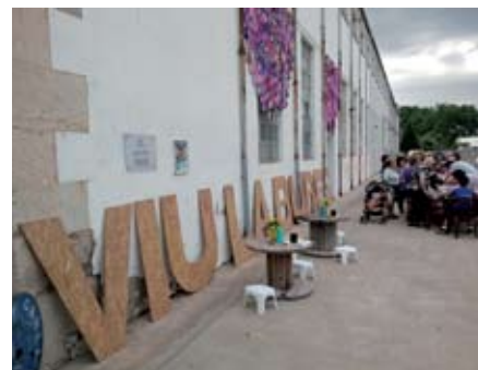
Viu la Burés