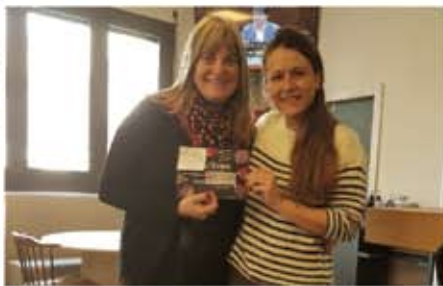
ECONOMIE - ESSENCIA Perruquers - Ferreteria CASTANYER - Fonda TARRÉS - Carnisseria MANEL - Loteria EL PEIXET D'OR - Ferreteria BOSCH CHARTER - Estètica Especialitzada IGNA - Inma Adroguer MODISTA - Drogueria REVERTER - Floristeria SANT MIQUEL - COSINT IDEES Merceria Creativa - El Celler del BON VI - Joieria MORAGAS - CHARTER - La RUTLLA Cafè - HOST COMPUTER - Fotografia PEDRAZA - Forn de pa EL LLEVAT - LA REPÚBLICA Cafè - Farmàcia TERESA FRANCH - L'Estètica IOLANDA RIBA - D'ARIS