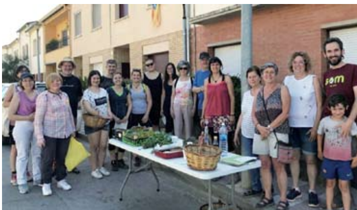
Recollint herbes ratafia