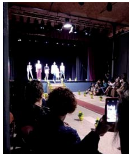
Viu la Burés