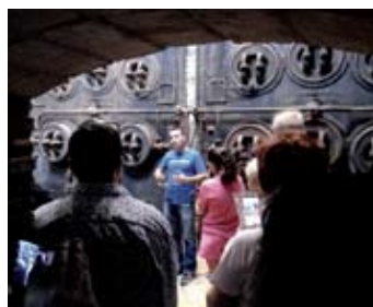
Viu la Burés