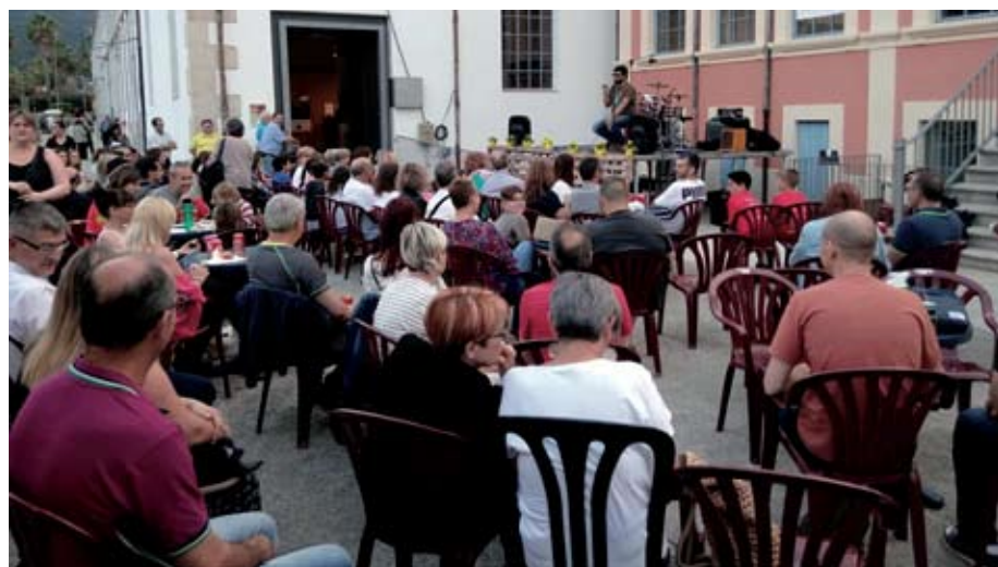
Viu la Burés